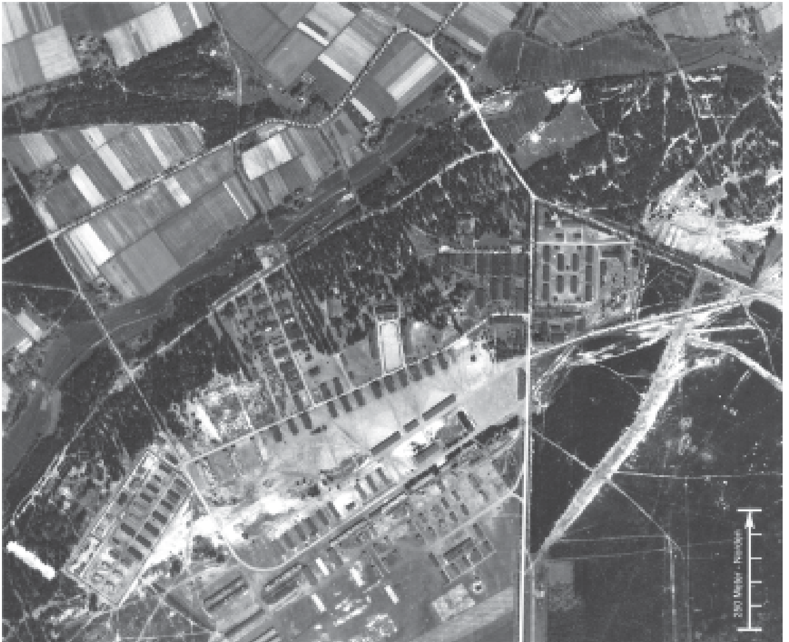
Lager Staumühle 1944: Foto vom Samstag, dem 13. Mai 1944. Flughöhe: 28000 Fuß. Grafik: Michael Weber. Ausschnittvergrößerung. Sortie 16829. Photo: 5017.