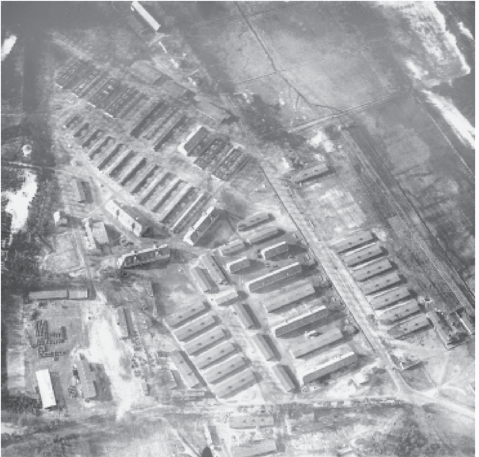
Lager Staumühle 1920: Blick nach Westen. Flughöhe: 700 Meter.

Aufnahme vom Montag, dem 26. Januar 1920, um 13.00 Uhr. Ausschnittvergrößerung.