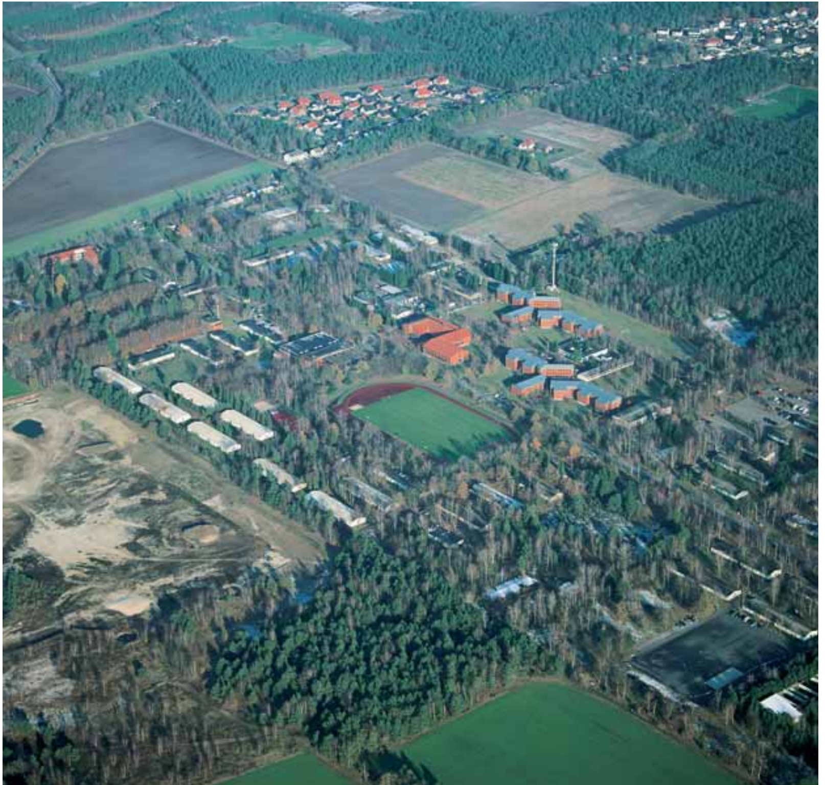
Stukenbrock-Senne (Kreis Gütersloh) 2005: Blick nach Norden. Das Polizeiausbildungsinstitut. Oben rechts: Stukenbrock-Senne. Aufnahme vom Donnerstag, dem 1. Dezember 2005, gegen 12.15 Uhr.