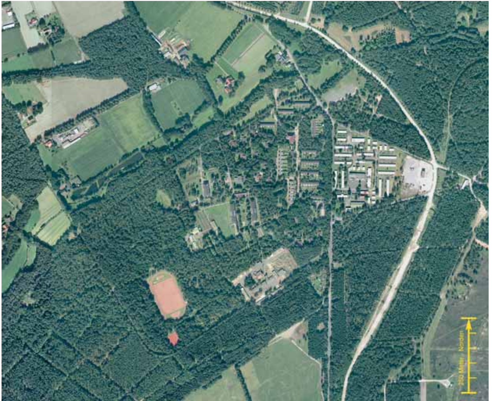
Hövelhof-Staumühle 2000: Orthofotos vom Freitag, dem 9. Juni 2000 und 3. September 2004.